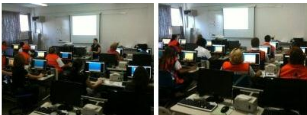
Figura 1. Sala de realização do treinamento com os participantes, no dia do treinamento.

O treinamento aconteceu na sala de informática da Escola de Governo e Desenvolvimento do Servidor (EGDS), um centro que oferece cursos, palestras e eventos visando o crescimento profissional e pessoal dos servidores públicos de Campinas e região. Tal espaço foi cedido para o treinamento por meio da solicitação do diretor da Defesa Civil de Campinas.