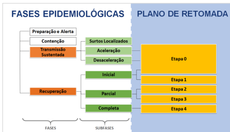
Figura 2 - Fases Epidemiológicas x Etapas de Plano de Retomada